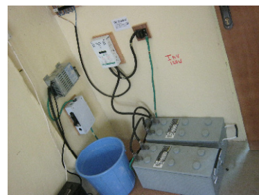
Nový bateriový systém, vč. kyblíku!

Takže jeden z mých hlavních úkolů bylo, vyřešit tuto frustraci a nainstalovat nové bezdrátové přístroje. A jako vždycky, nebylo jednoduché je udržet v chodu, když elektřina vypadávala. Takže jsem najal místního elektrikáře, který nám sestavil nový bateriový systém – vlastně to dělal dvakrát, protože ty první baterie moc dobře nefungovaly. Také jsme měli problém s dírou ve střeše, která byla přesně nad tímto systémem! Což byla další „radost“ v období dešťů! Takže nám to všechno trvalo déle, než jsme předpokládali, ale teď je už střecha opravená a bezdrátový systém funguje.