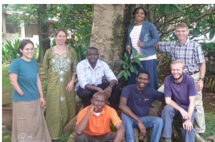
Pracovníci oddělení „Průzkum jazyků“

V Nigérii je ještě stále hodně zapadlých míst, kde místní jazyky ještě nebyly zmapovány a prozkoumány, a proto Nigeria Group má oddělení „Průzkum jazyků“, které je tvořeno 4 Američany a 5 Nigérijci. Jejich prací je cestování z vesnice do vesnice v odlehlých místech, vedení pohovorů s místními lidmi, aby zjistili, kolika jazyky se v dané oblasti hovoří a které z nich potřebují překlad Písma.