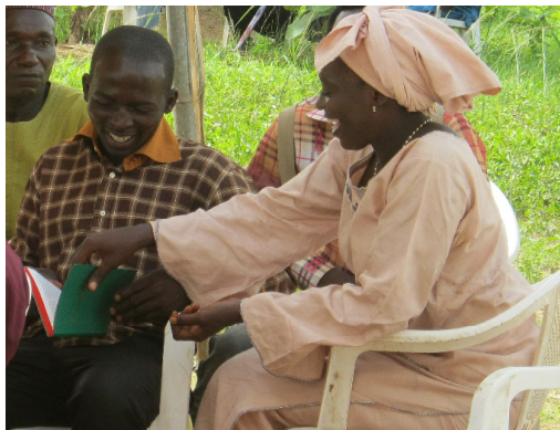
Čtení Ninzo Nového zákona

9. června jsem se zúčastnil dedikace Nového zákona v jazyce Ninzo, což bylo pro mě velké privilegium. Tímto jazykem hovoří kolem 100 000 lidí, kteří žijí asi 2 hod. cesty od Jos. Lidé tuto dedikaci oslavovali tradičními tanci a každý měl příležitost si zakoupit Ninzo Písmo, které bylo překládáno a připravováno 16 let.